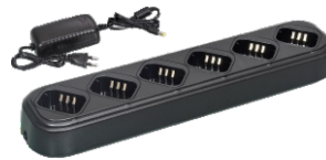
Çoklu Şarj Cihazı