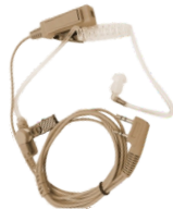
Tüp Akustik Ten Rengi Kulaklık Mikrofon