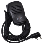
Yaka Tipi Hoparlör Mikrofon